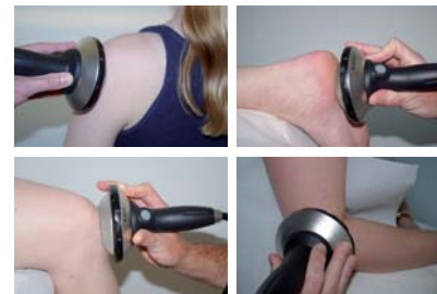
Die Stoßwellentherapie ist eine schonende Behandlung gegen chronische Schmerzen, z.B. an Schulter, Fuß, Knie oder Ellenbogen.

Die Stoßwellentherapie dient in der Orthopädie zur Behandlung chronischer Schmerzen, besonders im Knochen-Sehnen-Übergangsbereich und an den Muskelansätzen. Diese schonende Behandlungsmethode erfasst nur die Körperstrukturen, die im Fokus der Stoßwelle liegen. Dafür wird ein spezieller Schallkopf auf der Haut des Therapiegebiets positioniert und die Dosis an die Konstitution und Beschwerden angepasst. Dadurch wird umliegendes Gewebe geschont. Stoßwellen sind hochenergetische kurze Schalldruckwellen. Sie bewirken eine Mechanotransduktion, bei der fokussierte Impulse in biochemische Reaktionen zur raschen Reparatur erkrankten Gewebes umgewandelt werden. Sogenannte Botenstoffe, die den Hei-