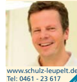
www.schulz-leupelt.de Tel: 0461 - 23 617