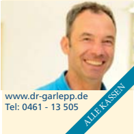
www.dr-garlepp.de Tel: 0461 - 13 505