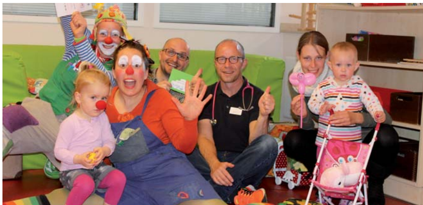
Auch die Kinder hatten viel Spaß mit den Klinikclowns der DIAKO.

Interessante Ein- und Ausblicke in alle Praxen, Vorträge, Testmöglichkeiten.