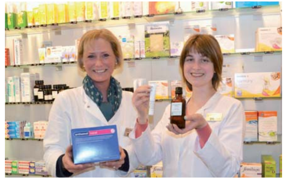
Arzneimittel & Pflegeprodukte für Mutter und Kind. Wir beraten Sie gerne.

Bei uns gibt es auch ein besonderes Produktsortiment, welches bei verschiedenen Beschwerden während der Schwangerschaft, zur Geburtsvorbereitung bzw. bei der Nachsorge, als auch beim Säugling angewendet werden, und von Hebammen und Gynäkologen empfohlen wird: dazu zählen die ORIGINAL STADELMANN®-AROMASCHÜNGEN . Diese sind naturrein und werden in der Bahnhof-Apotheke in Kempen/Allgäu hergestellt. Egal ob für die schwangere Frau das Kreuzbeinöl oder für den Säugling den Engelwurzelsbalsam gegen eine verstopfte Nase... alle Produkte sind frei