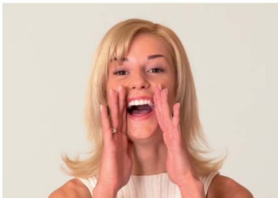
Gute Gelegenheit im CITTI: Alles ansehen und spannende Vorträge hören...