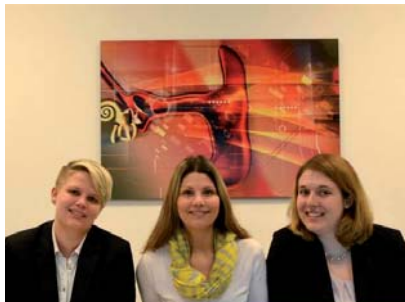
Schlecht Hören ist anstrengend, macht Kopfschmerzen und muss nicht sein.

„Kommunikations- und Orientierungsfähigkeit bei unseren Kunden wieder herzustellen, ist unsere Leidenschaft!“ Pavel Hörgeräte legt Wert darauf, dass die Hörgeräte bezahlbar bleiben und das Preis-Leistungs-Verhältnis stimmt. Kundenzufriedenheit und Qualität stehen in unserem Unternehmen an erster Stelle. Das durchweg positive Feedback bestätigt uns jeden Tag in unserer Arbeit, denn Pavel Hörgeräte - das steht für Qualität.